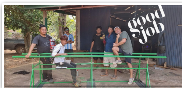
Samen met de Boys sporttoestellen maken