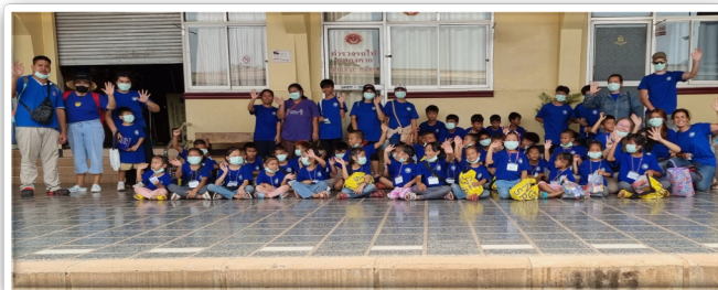
Treinreis met de kleintjes naar Udon Thani