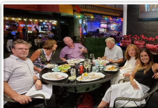
Bijpraten onder het genot van een hapje en drankje met het team van Stichting de Vaan Goosen