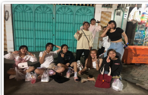
Shoppen met de meiden op de lokale markt