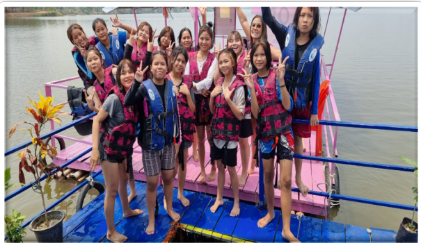
Een middagje plonsen in het meer