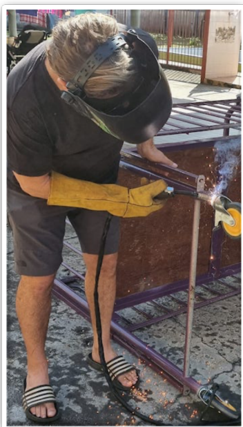
Wieltjes vastzetten aan Nuna's bed