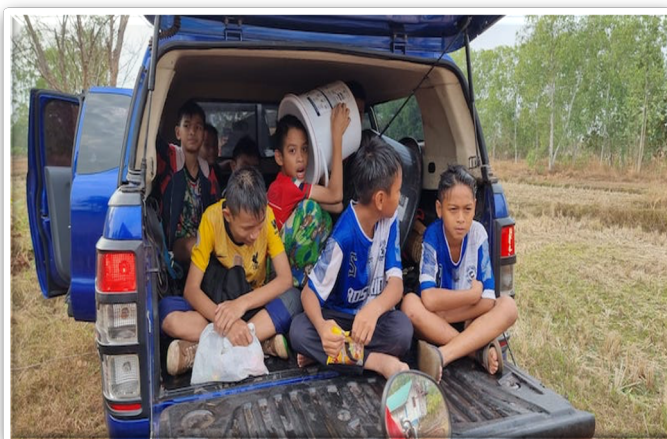
Moe maar voldaan na een dagje vissen